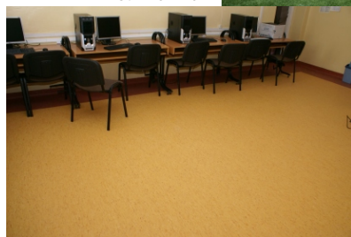
Szkoła w Chudku

W Urzędzie Gminy jesteście Państwo otoczeni życzliwością i uprzejmością. Każdy inny sygnał natychmiast jest wyjaśniany i sprawiedliwie rozstrzygany. Mam nadzieję, że mój sposób sprawowania urzędu jest przez Państwa akceptowany. Zawsze staram się pomóc, znaleźć czas na chwilę rozmowy, obecność podczas zebrań wiejskich, sołeckich, uroczystości. Gmina stała się czystsza. Zmieniliśmy uchwałę Rady Gminy o utrzymaniu porządku, dzięki czemu osoby starsze, samotne, biedniejsze mogą korzystać z mniejszych koszy na śmieci, oszczędzając w ten sposób nieco pieniędzy. Wkrótce, dzięki owocnej współpracy z Zakładem Gospodarki Komunalnej, odpady wielkogabarytowe, gruz zalegający na posesjach, baterie, szkło, przestaną być problemem. Każdy z nas będzie mógł oczyścić swoje piwnice i na bieżąco zbywać zbędne odpady. Będzie to nowoczesne rozwiązanie.