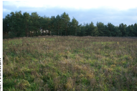
Zrekultywowane składowisko odpadów w Brzozówce