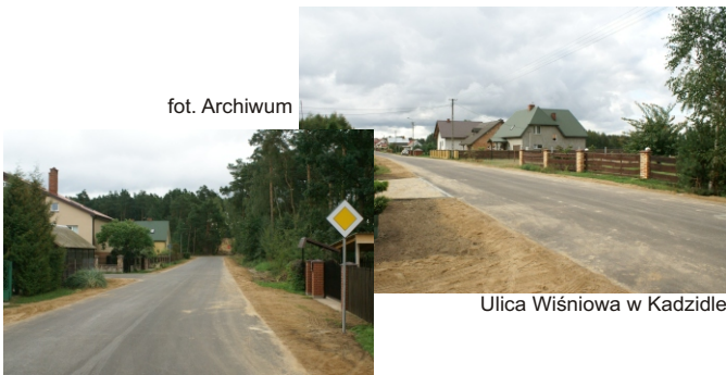
Ulica Żołnierzy Września w Kadzidło

Z pewnością nie wszystko uda się wykonać, jednak zaręczam Państwa, w imieniu swoim oraz radnych pracujących w tej kadencji, że będziemy próbować wykorzystać każdą, nawet najmniejszą szansę.